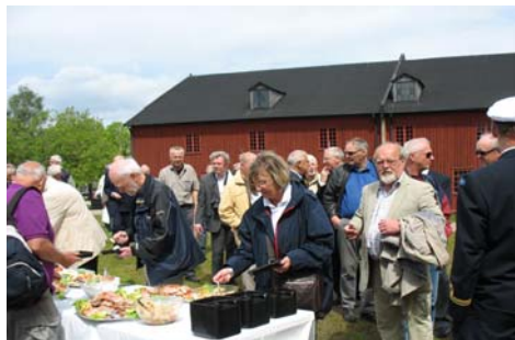
Buffé och mingel