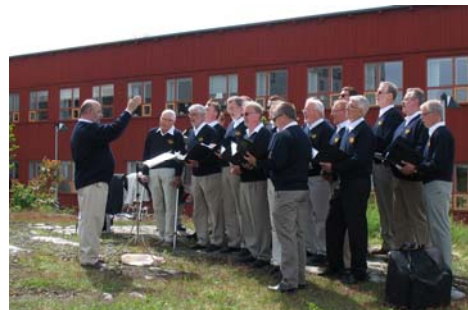
Den skönsjungande kören

Högtiden inleddes med en lätt buffé på den gamla stationsplatsen samtidigt som en lokal manskör underhöll med sommarsånger med prunkande syrenbuskar som bakgrund. Efter välkomsttal av chefen för Marina radion, örlogskaptен Niclas Lyngstam startade programmet med en kort information av Carl-Henrik Walde som övergick till ett lyssnande på när världsarvsstationen Grimeton SAQ sände hyllningsmeddelande till de samlade: