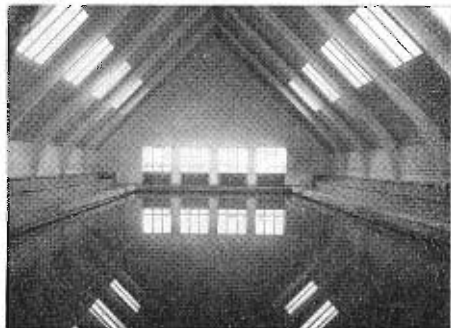
En interiör från simhallen

släpps upp ensamma. Utöver sin huvuduppgift som jaktflottilj fungerar alltså F 16 nu även som typinflygningskola, TIS, genom vilken i fortsättningen samtliga 35-förare kommer att passera. De kullar fältflygare som hittills genomgått TIS 35 har givit enbart positiva intryck. Bland annat har dessa elever landat betydligt bättre än sina äldre och mer rutinerade kamrater. Sönderslagna sporrar har tyvärr förekommit alldeles för ofta hittills, både på F 16 och övriga 35-förband.