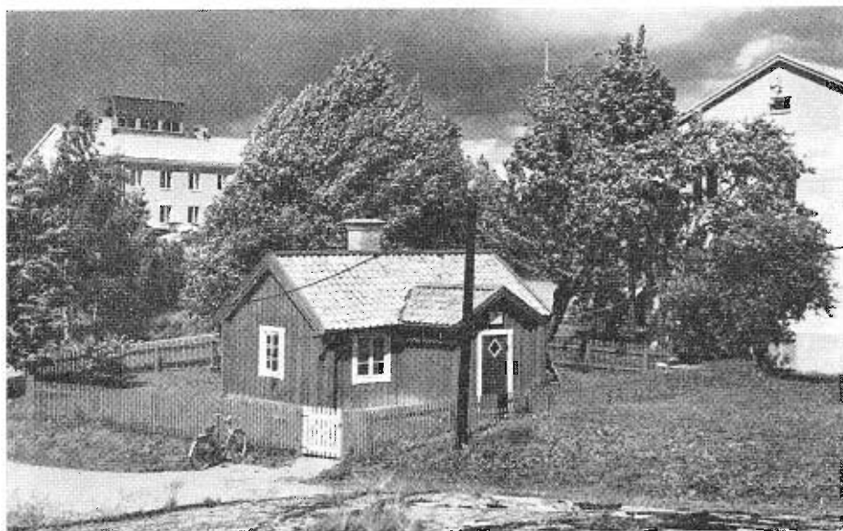
Fr.v. kanslihuset, soldatorpet och skolsalsbyggnaden

Tidigare har nyblivna aspiranter och fältflygare efter examen från Ljungbyhed gått direkt över till ensitsiga J 29. Steget från J 28 Vampire till J 35 Draken är emellertid åtskilligt större, varför behov av annan inflygningsmetodik uppkommit. Med hjälp av tvåsitsiga Sk 35 C och simulatorer får nu de färskaste eleverna flyga åtskilliga pass i dubbelkommando och på marken innan de