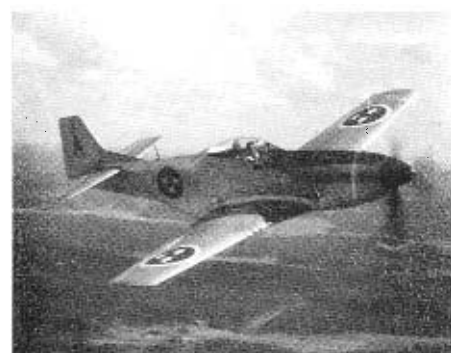
J 26 Mustang

Flygvapnet hade genom inköp i USA förvärvat ett antal nya jaktflygplan av typen J 26 Mustang. Dessa flygplan tillfördes nu F 16, vars slagkraft därigenom starkt ökades. En intensiv utbildning igångsattes våren 1945 under ledning av erfarna amerikanska jaktflygare. Normal