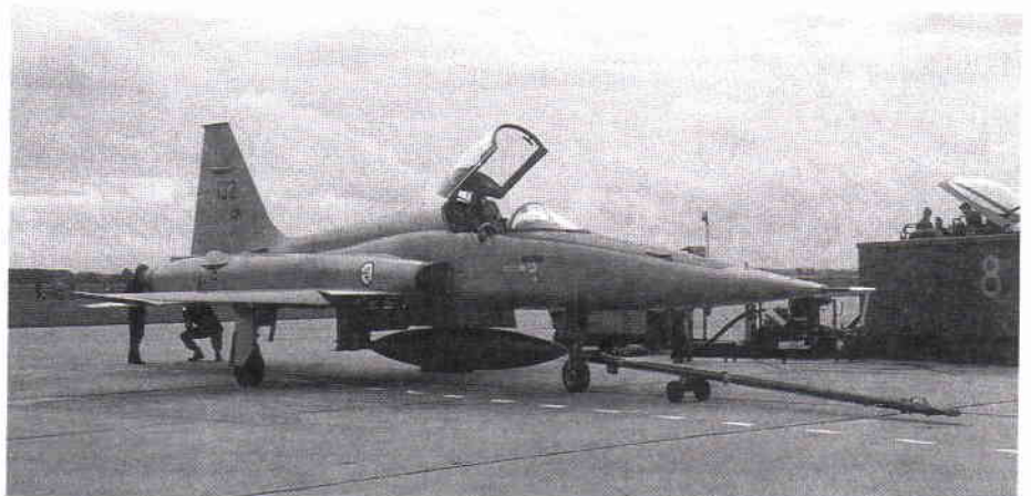
En norsk F-5 Freedom Fighter (tillverkare Northrop, USA).