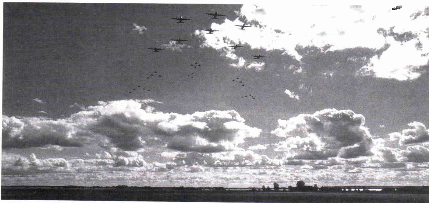
DEFILERINGEN. En magnifik avslutning på ett ståtligt program fick publiken att tappa andan!