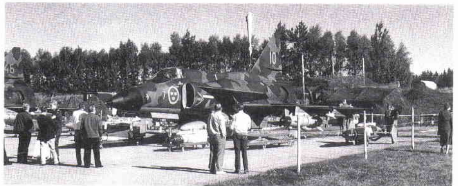
AJ37 med RB 15 F och RB 24 J.