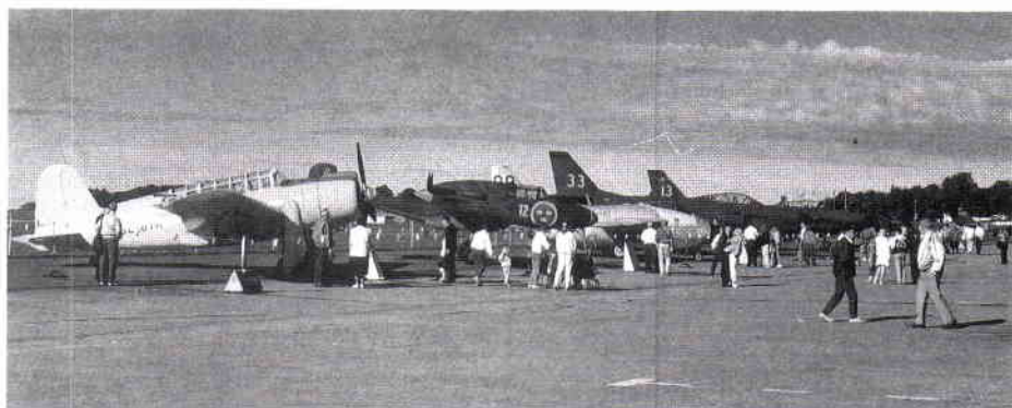
Några flygplantyper som funnits på F7.

Från vänster till höger: B17, A21 (Tvestjärten), S29 (Tunnan), A32 och J32B (Lansen).