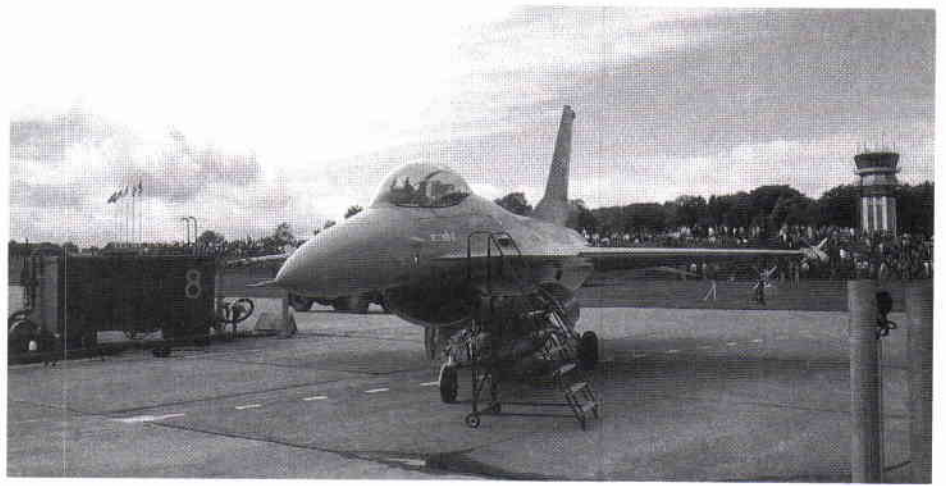
F16 – Fighting Falcon (tillverkare General Dynamics i USA), levererades till Norge och Danmark 1980.