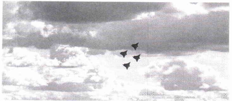
En fyrgrupp J35 under avancerad formationsflygning.