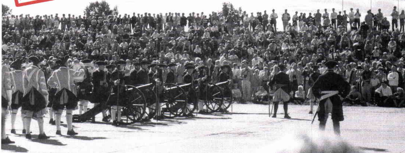
Uniformer, musköter och kanoner är rekonstruktioner men gjorda efter originalritningar.