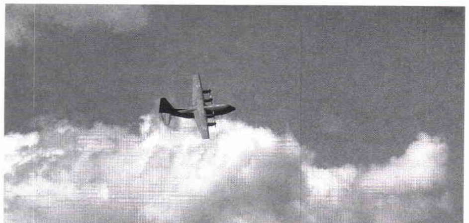
Tp84 – 841. Enskild uppvisning.