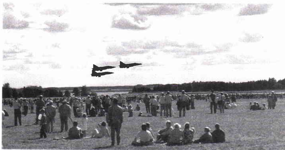
Tre av F7 fyrgrupp AJ37 strax efter lättningen.