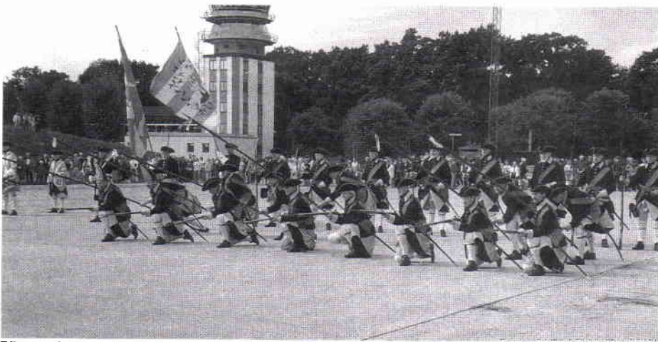
Karolinerna klara för anfall.