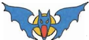
2 div F 1