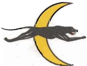
3 div F 1

På F 3 har divisionerna samsats om samma emblem med undantag för olika fondfärg. Symbolen i emblemet är en silhuett av den kända Folke filbyterstatyn. Bakgrunden för 1:a divisionen är röd, för 2:a blå och för 3:e gul.