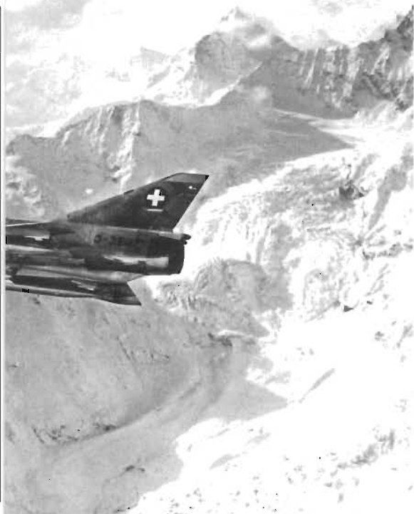
utgör kärnan i de schweiziska jaktflottorna med Matfer (effektfull) bak-

beslöt att en förnyad värdering skulle ske och omfatta — förutom de båda finalisterna — även SAAB 105, A-4 Skyhawk, M-5 Mirage-Milan och så småningom även en moderniserad Hawker Hunter, som redan ingick i det schweiziska flygvapnet.