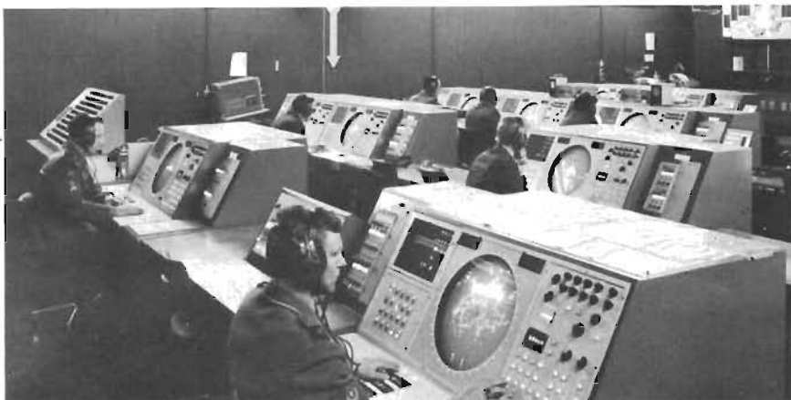
● FLORIDA-systemet är Schweiz Stril 60. Här ser vi en luftförsvarcentral, för utbildning av milissoldater.

► Enligt underhandsuppgifter lär Viggen betraktas som den tekniskt bästa lösningen medan kostnaderna däremot anses avskräckande höga. I den allmänna debatten har därför på sistone – med de felaktiga slutsatserna från den senaste Mellanösternkonflikten i färskt minne – allt fler röster höjts för en starkare satsning på luftvärnsrobotar i stället för på jaktflyg.