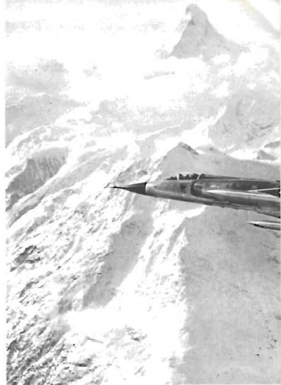
● Mirage III-S i det schweiziska svaret. Här horn som grund.

I flygsammanhang noterbart är också landets litenhet – en tiondel av Sveriges areal – samt dess egenartade topografi.