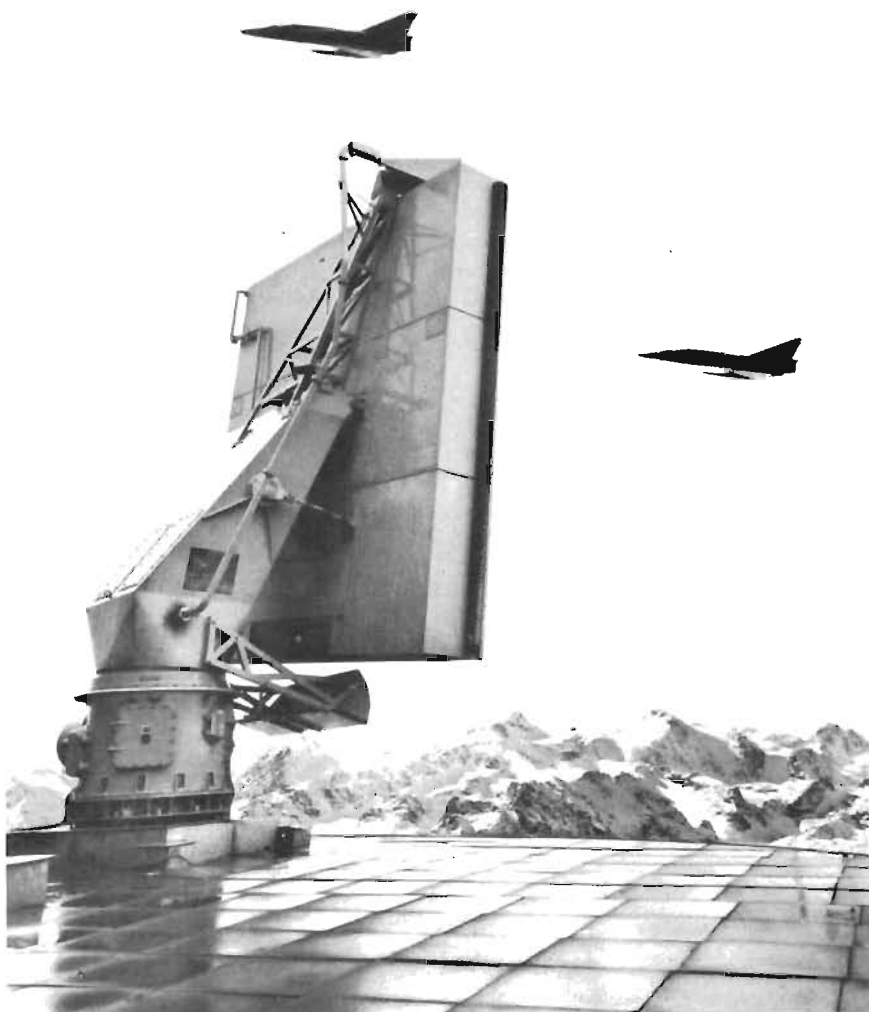
● Enradarkomponent på en bergstopp riktar sitt vakande öga mot en rote Mirage III-S.

Till helt nyligen utvärderades typerna Mirage F-1, F-5 E Tiger och JA 37 Viggen. Under detta år beräknas regeringen fatta ett beslut på grundval av förslag från försvarsdepartementet. Hurvida den — och senare parlamentet — kommer med ett för flygvapnet positivt beslut är det dock nu för tidigt att förutsäga, inte minst mot bakgrund av erfarenheterna från 1972. ▶