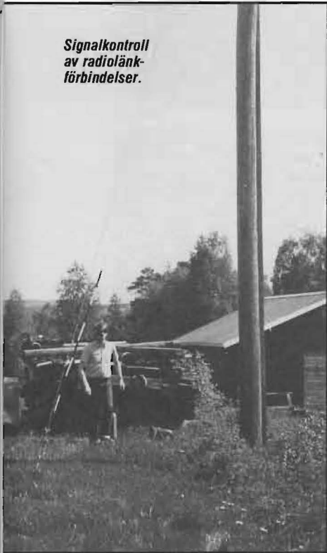
Signalkontroll av radiolänk-förbindelser.

Vilka skall utbildas? – Ett grundläggande krav är att all personal som handlägger signal-skyddsärenden, eller som betjänar eller på annat sätt handhar sambandsmedel skall ha erforderlig kunskap om signalskydd. Denna personal kan delas in i tre kategorier: