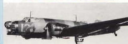
B 3 (Saab, Trollhättan) 1939

SAAB jubilerar! FV gratulerar stående på 50-årsdagen! Det var 1937 som Svenska Aeroplan Aktiebolaget bildades. I Trollhättan, "visserligen". I Linköping fanns vid den tiden ASJA/AB Svenska Järnvägsverkstäderna – sedan 1930 även med en aeroplanavdelning. 1939 slogs företagen ihop. Dagens Flygdivision inom SAAB-SCANIA-koncernen har således sina linköpingsrötter ur den fusionen. ★ Den spännande utvecklingshistorien om en av världens bästa flygindustrier läser Du bäst i Björn Olsons "En bok om Saab-Scania", nyutkommen i boklådorna. Eller lika gärna i skriften "Kontakt 81", som Bo Widfeldt så förträffligt lyckliggjort medlemmarna i "Kontaktgruppen för flyghistorisk forskning" med. ★ På sid 10–12 visas de flygplan som FV med SAAB:s hjälp periodvis hållit i luften under de gångna 50 åren. På sid 32 ses jubilarens bidrag till FV:s och Sveriges neutralitetsförsvär. (Årtalen anger tidpunkt för "jungfruflygning".) ■