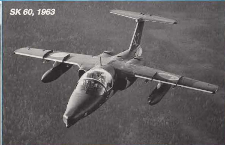
SK 60, 1963