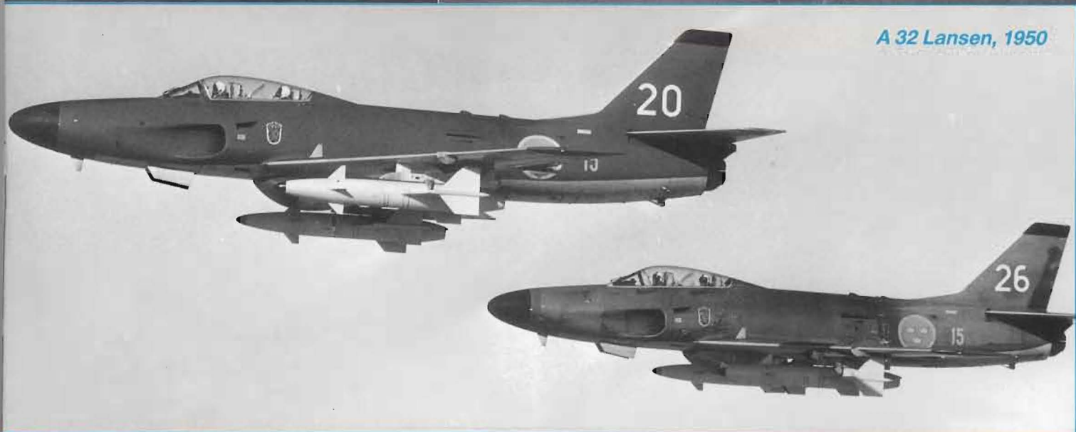
A 32 Lansen, 1950