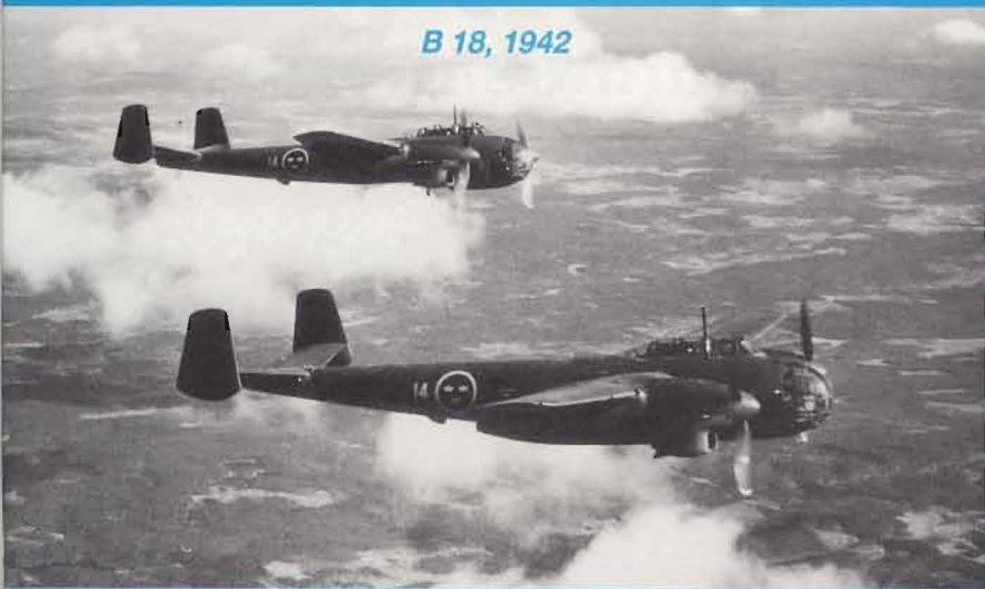
B 18, 1942