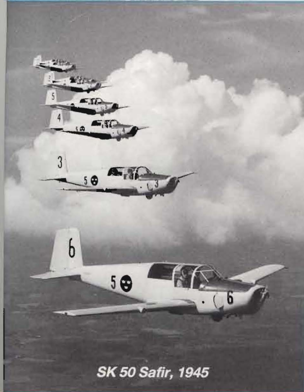
SK 50 Safir, 1945