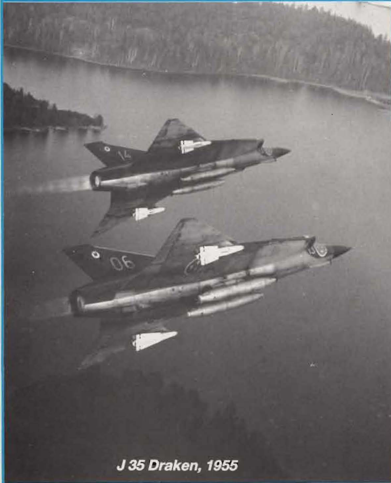
J 35 Draken, 1955