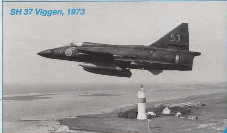
SH 37 Viggen, 1973