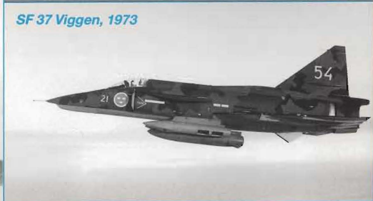
SF 37 Viggen, 1973