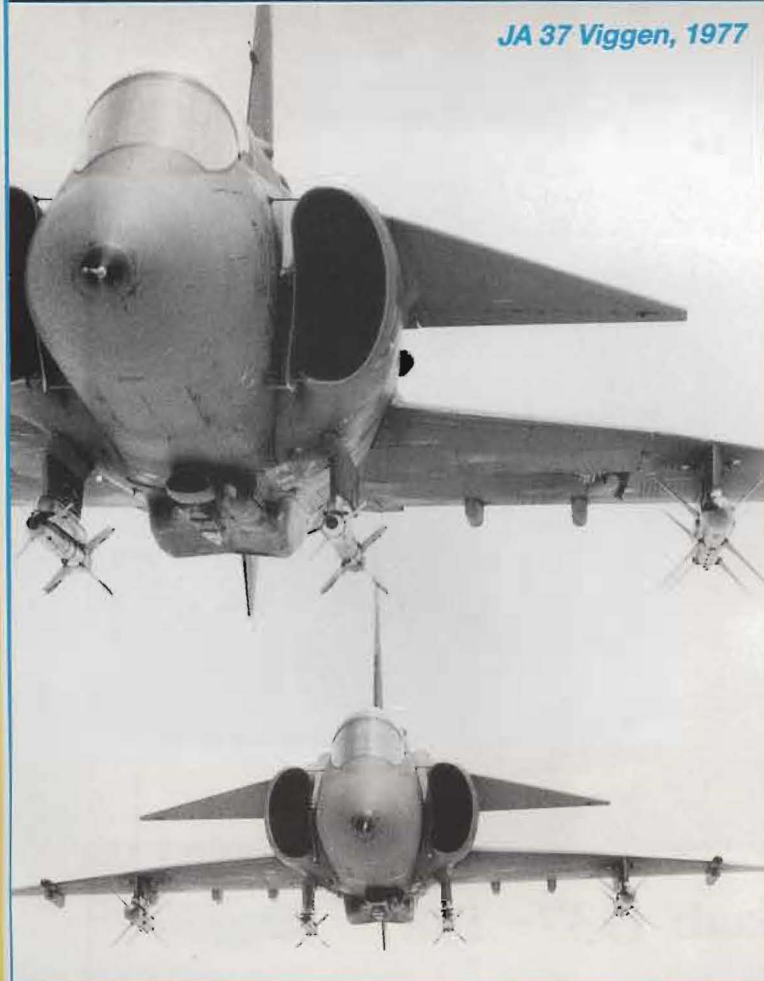
JA 37 Viggen, 1977