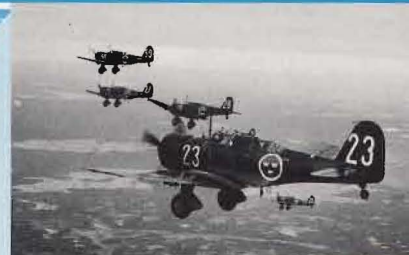
B 5 (ASJA/Saab), 1939