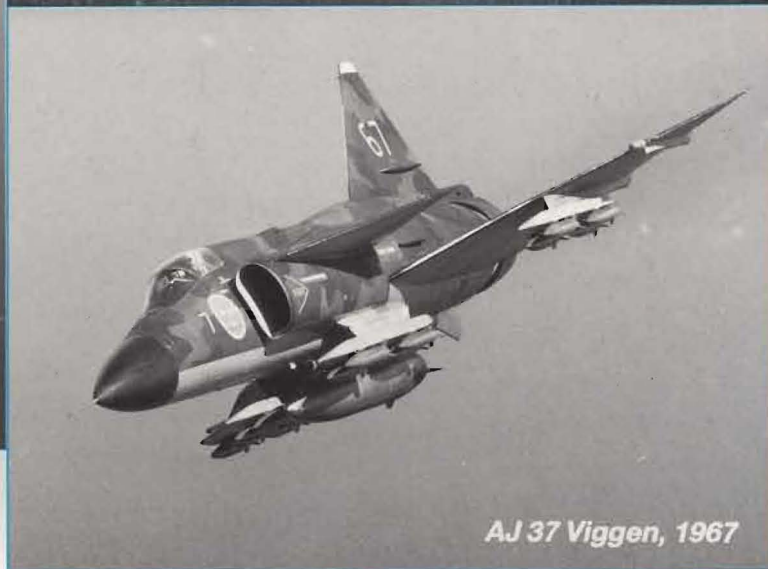
AJ 37 Viggen, 1967