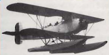
Ö 9 (ASJA), 1932 SK 11 (ASJA), 1935