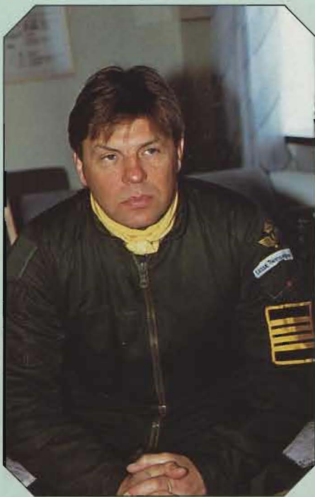
"Omedveten varseblivning" är Lelles recept för prestationsförbättring.

da utmärkelsen "Världens bästa, militära idrottsman alla kategorier".