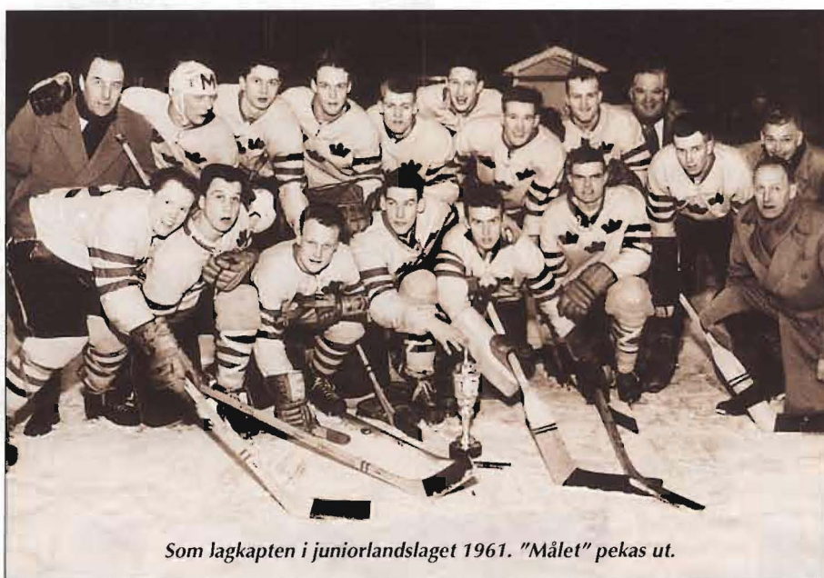
Som lagkapten i juniorlandslaget 1961. "Målet" pekas ut.

KN: Ja, i allra högsta grad. Coachen är den närmaste ledaren som har att leda, företräda och utveckla laget, så att det blir ett så bra resultat som möjligt. Det beror i allra högsta grad på coachens kunskaper och förmåga att entusiasmera sina medarbetare vare sig det är spelare i ett ishockeylag eller soldater i ett militärt förband.