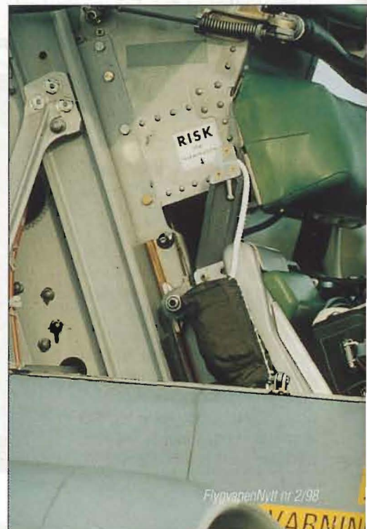
FlygvapenNytt nr 2/98