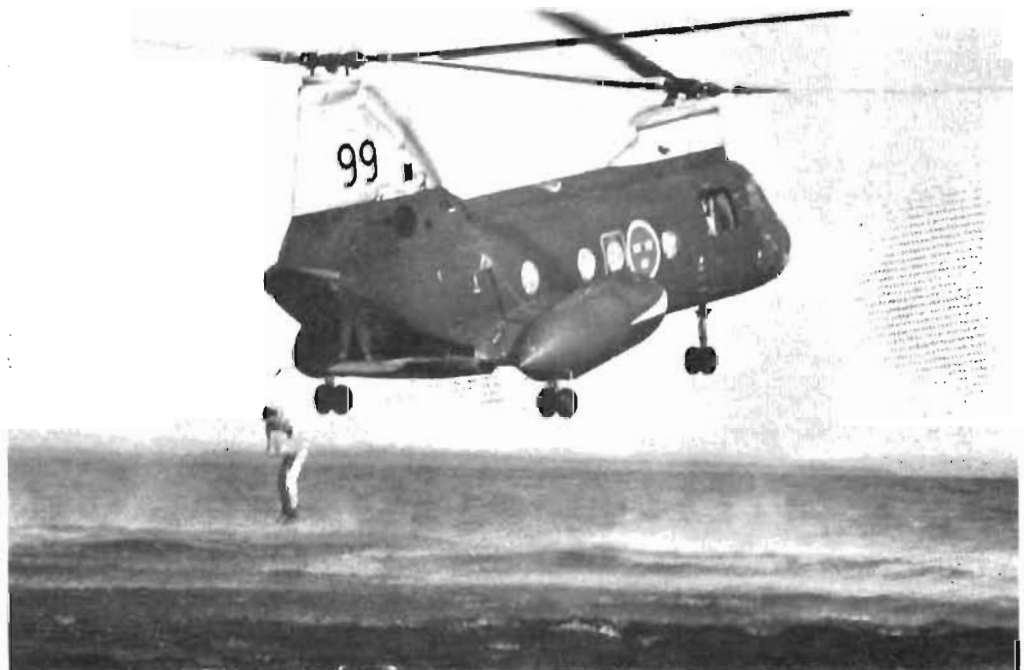
Enbart införd sommarflygdräkt, flytväst och gummbåt "plumsade" de olika flygplanbesättningarna ned från helikoptern i det 12-gradiga vattnet. — Det är härligt med realistiska övningar...