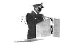
F21 - 25 år