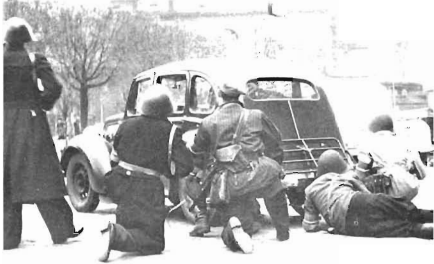
Fig 5 Fig 6

● Starka tyska krafter — flyg, markförband och enheter ur tysk marin m m — står alltjämt intakta i både Danmark och Norge. Det är osäkert hur dessa skall förhålla sig vid det nu allt ofrånkomligare