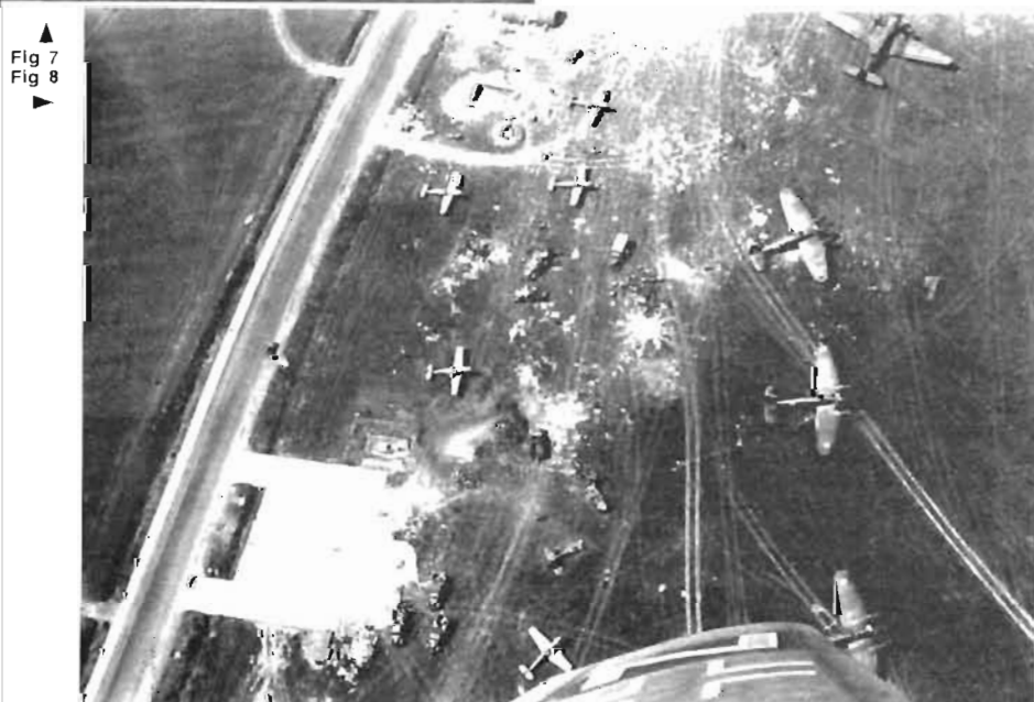
Fig 7 Fig 8