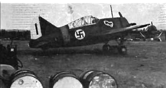
● Brewster 'Buffalo' — USA-tillverkat, svensk-monterat jaktplan i finsk krigstjänst.

Den 20 oktober 1944 har USA-krafter landstigit på av Japan ockuperade ögruppen Filippinerna. Strider pågår sedan där ända till den 4 juli 1945. Atombombanfall mot de japanska städerna Hiroshima och Nagasaki, den 6 respektive den 8 augusti 1945, bryter stultigt det sega motståndet från Nazi-Tysklands i storkriget allierade, stormakten Japan. Sovjetryssland, som vill vara med om att dela stora, tidigare japanska landvinningar i Fjärran österns rika länder