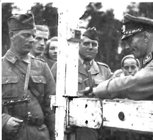
● Norsk-svenska gränsen öppnas åter.

Den 12 januari 1945 inleds den ryska vinteroffensiven. Redan inom mindre än två veckor har den nått fram till floden Oder, knappa 100 km öster om Berlin. Under februari fullbordas den ryska uppmarschen längs Oder, och i samband därmed upprättas en rad brohuvuden på västra stranden. Luftwaffe, det tyska flyget, är efter sina svåra förluster i väster och i