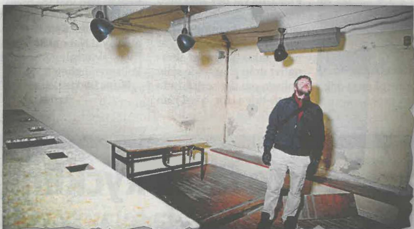
I flygvapnets gamla luftgruppcentral hittar man spår efter det förlutna. En upphöjd bänk som personalen satt vid och "plottade" på kartor. Armaturerna i taket skvallrar om olika tidsepoker.