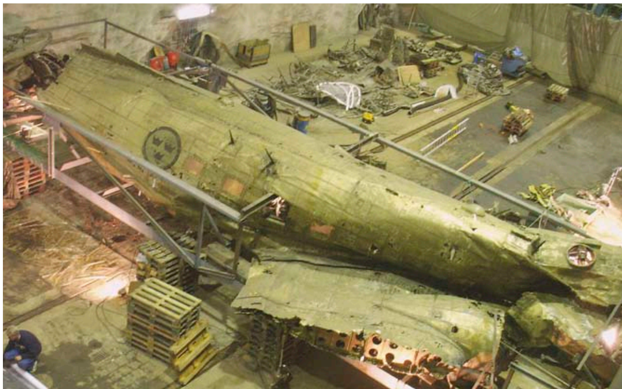
På Musköbasen korrosionsskyddsbehandlades flygplanet av Flygvapenmuseum. Samtidigt pågick den tekniska haveriutredningen över vad som hände DC-3:an den 13 juni 1952.