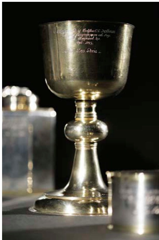
Krigsbytte från Poltava.

Ombyggnaden innebar framför allt att utställningarna kom att utökas med minst en tredjedel mot tidigare. Av en total yta av 6 000 kvadratmeter är nu 4 500 utställningsyta. Det är nästan bara golv och ytterväggar som inte har förändrats. Någon restaurang har inte funnits tidigare och en mycket modernt utrustad hörsal har byggts in på vindsvåningsplanet, där museimagasinen tidigare fanns. Samtidigt har i stort sett alla äldre detaljer bevarats. Nya branddörrar med samma profiler som trädörrarna har tillverkades för att smälta in i miljön. I utställningsarbetet har den modernaste tekniken använts