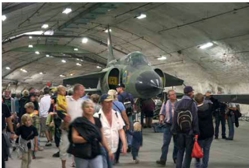
Besökare är det gott om på Aerozeum – här ser vi en Viggen.

Skolorna visar ett ökande intresse av att besöka Aerozeum och vi bred- dar nu vårt utbud av lektioner för att vara en resurs och ett verktyg för lärarna. Deras ambitioner är att skapa uppväxande generationer som fortsätter att utveckla Sverige så som vi andra arbetat under årens lopp! ■