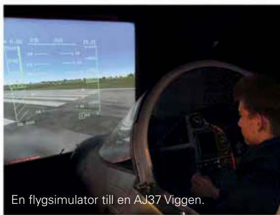
En flygsimulator till en AJ37 Viggen.

Aerozeum har i dagsläget fyra fungerande simulatorer och tre till under konstruktion. Våra flygsimu-