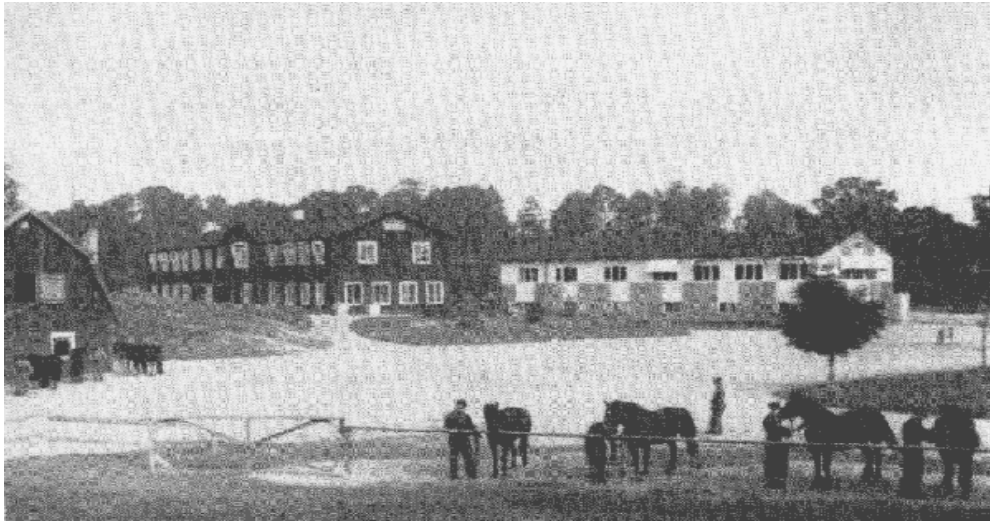
I den röda byggnaden i mitten låg elektriska verkstaden samt i det vita, f d ballongförrådet, elektriska laboratoriet.