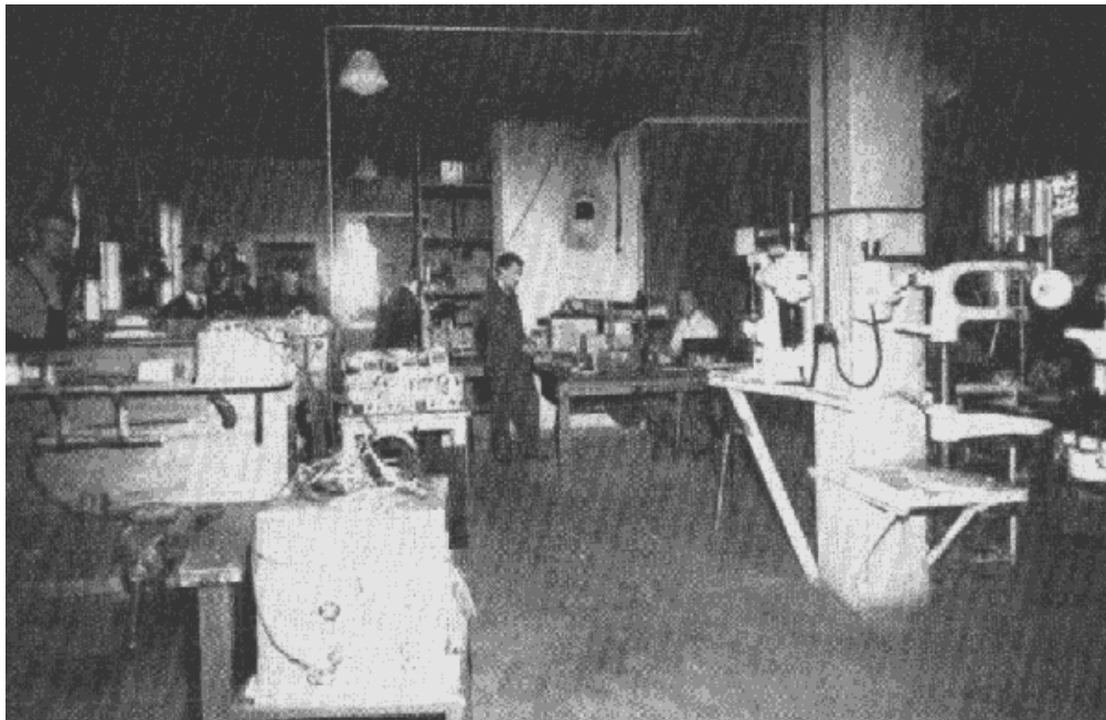
Elektriska verkstaden, nedre botten med monteringsverkstaden. Av bilden framgår att montering av 10 W Br pågår.