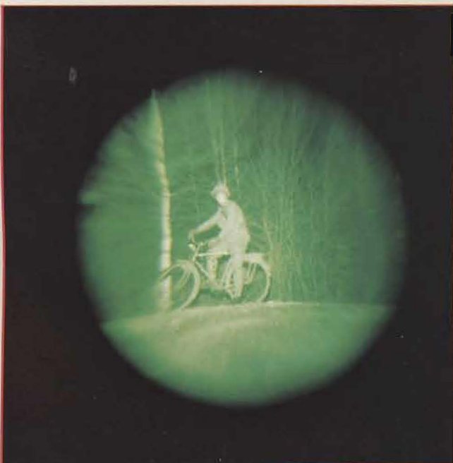
Med bildförstärkare ser man "fj" även i nattmörker.