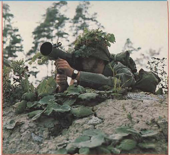
Parisarkott, modell -68.

fram. Utgångspunkten för detta är, att vår strid skall föras på ett mer aktivt och rörligt sätt än tidigare, samtidigt som eldkraften ökas. Hotet i markförsvaret bedöms främst ugöras av sabotagepatruller eller luftlandsatta grupper om maximalt 8-10 man. För att kunna skydda sig mot en motståndare av denna typ måste våra markförsvarsförband ha bättre rörlighet, eldkraft och terrängkännedom än motståndaren. Det är också mycket viktigt att en fiende inte skall känna sig säker för upptäckt utan ständigt tvingas till skyddsåtgärder och försiktighet. Tekniska bevakningshjälpmedel (minor etc) tillsammans med våra spaningspatruller bidrar till detta.