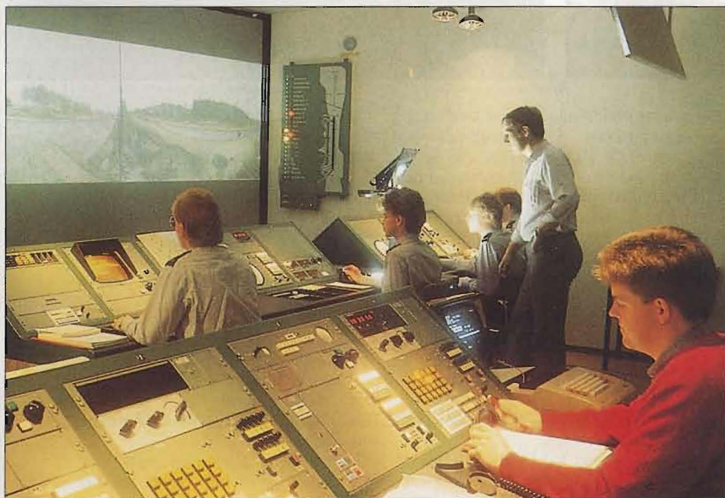
Utbildningsmiljön i FFL:s procedursimulator.