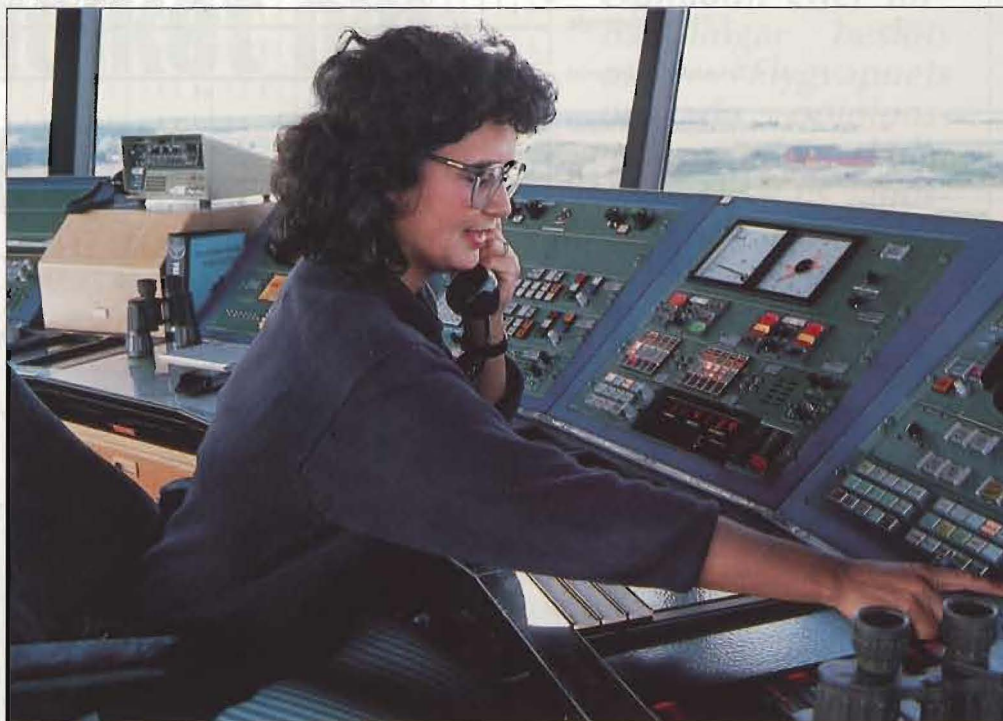
Arbetsmiljö för flygledare i flygplatskontroll.