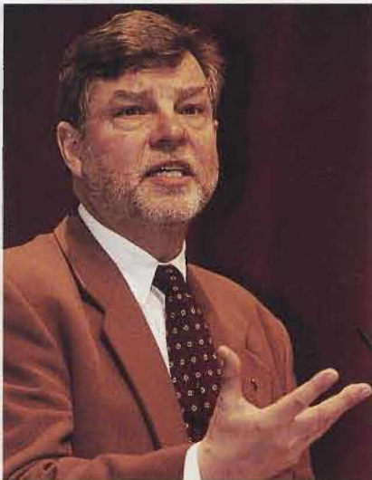
Försvarsminister Björn von Sydow (S).

Snabb process för att klara extrema besparingskrav