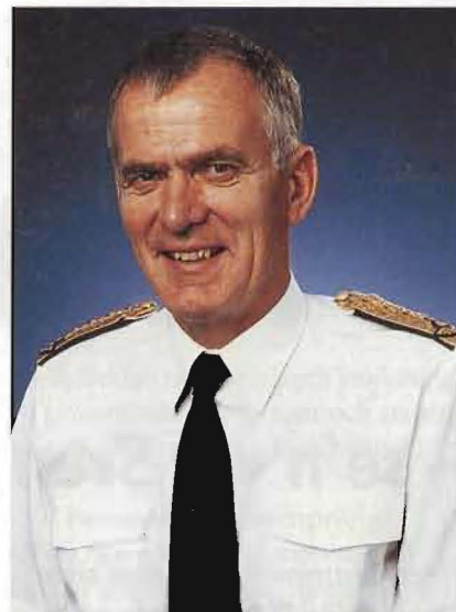
Överbefälhavare Owe Wiktorin leder arbetet med ominriktningen av Försvarsmakten.

Därefter startar det omfattande arbetet med att avgöra vilka faktiska konsekvenser beslutet får för Försvars-