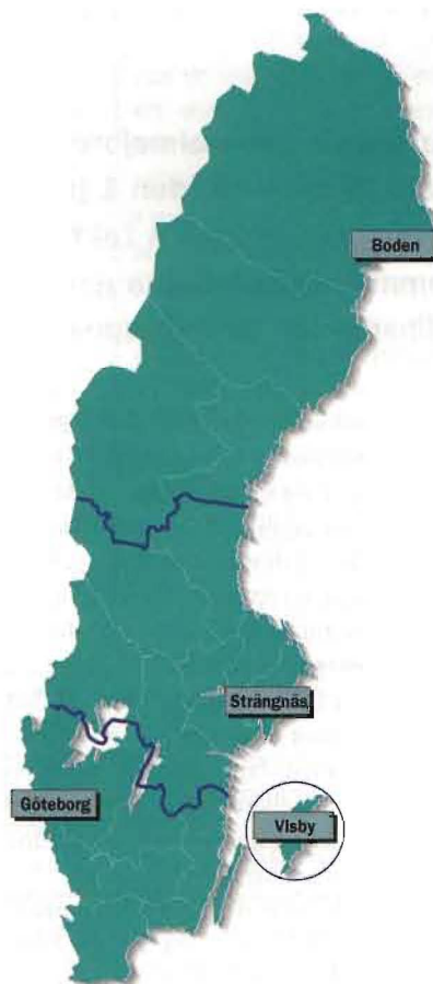
Den geografiska indelningen av de fyra militärdistrikten.

ARTIKELFÖRFATTAREN ÄR ÖVERSTE OCH TJÄNSTGÖR I FLYGVAPENCENTRUM