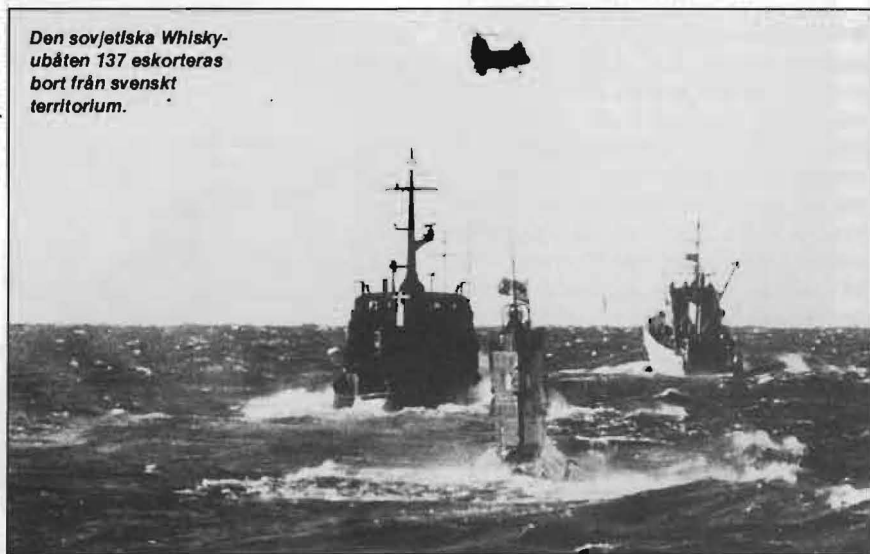
Ute på internationellt vatten väntade sedan länge ett flertal fartyg ur den sovjetiska Östersjö-marinen; bl a (t h) ett utbåtsbärningsfartyg.