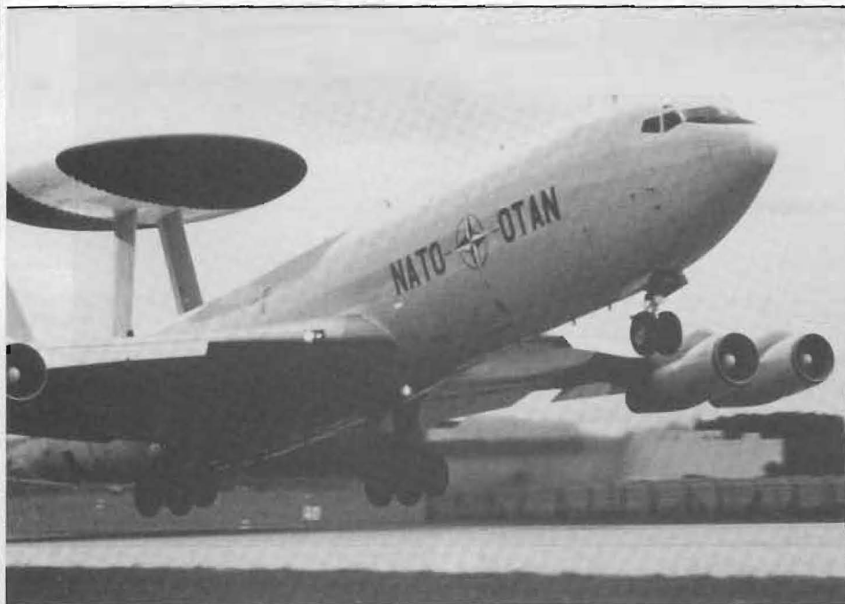
T v: NATO:s svar på "Moss" är E-3A "Sentry", som nu utprovats i Europa. Utvecklad ur Boeing 707.