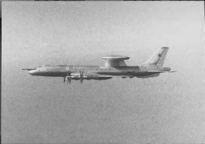
Ovan: Sovjetunionens radarspaningsplan för luftbevakning och stridsledning, Tu-126 "Moss" – en utveckling av civilflygplanet Tu-114 "Cleat".