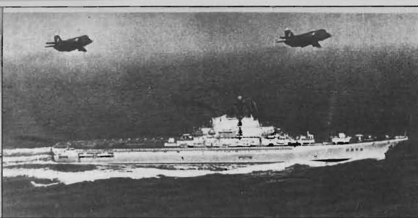
Hangarfartyget "Kiev" är, förutom hkp och rb, utrustat med flyg: Jak-36 "Forger" A+B. På sistone har "Forger" modifierats ovanför vardera sidoluftintag; två långsgående metallstråk kringgärdar upptill luftintaget till den kroppscentralt placerade lyftmotorn.