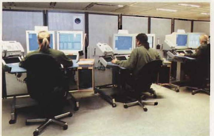
Flygtaktiska kommandot (FTK) i Uppsala leder flygvapnets verksamhet. Här har man t ex kontroll över var incidentberedskapens flygplan är baserade, vilka radarstationer som är aktiva och hur mycket stridsledningsresurser som finns tillgängliga.