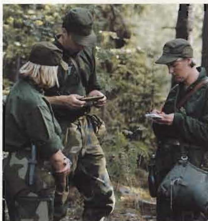
Ärenden rörande flygvapenanknuten frivilligverksamhet handläggs av FTK:s utbildningsavdelning.

För närvarande tjänstgör 20 personer vid avdelningen under ledning av överste