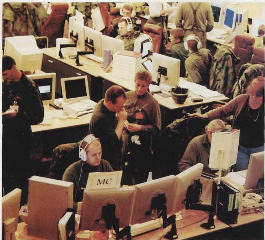
Det svenska flygvapnet har mycket att lära av sina norska kolleger, framför allt vad gäller terminologi och metodik. Utvecklingsgruppen i flygengelska kommer bland annat titta på det underlag, Annex A, som togs fram inför en övning vid CRC Mågerö.