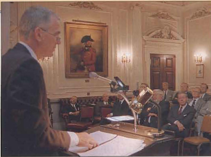
ÖB, general Owe Wiktorin, hållandes öppningsanförande.