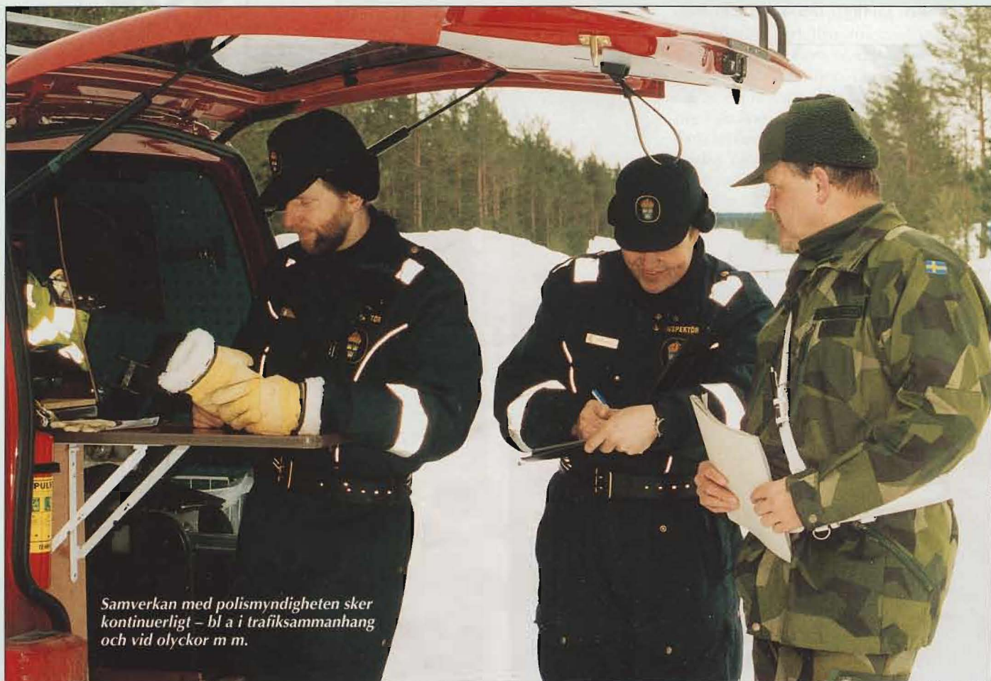
Samverkan med polismyndigheten sker kontinuerligt – bl a i trafiksammanhang och vid olyckor m m.