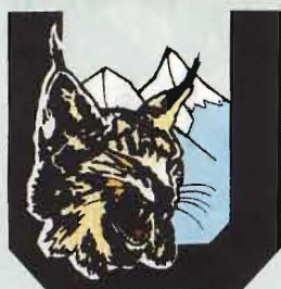
TP FLYG F 21