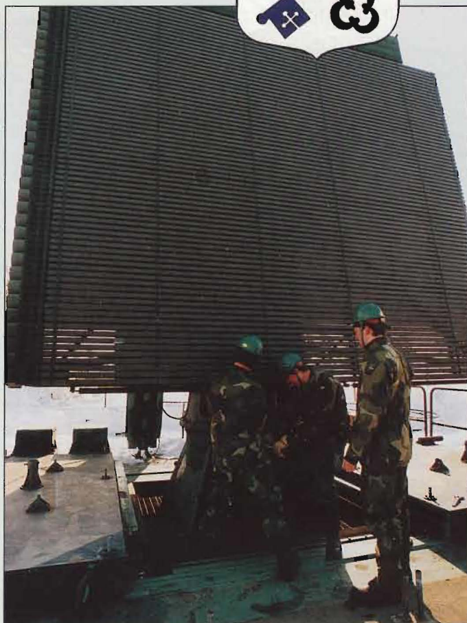
Arbete med PS-860.