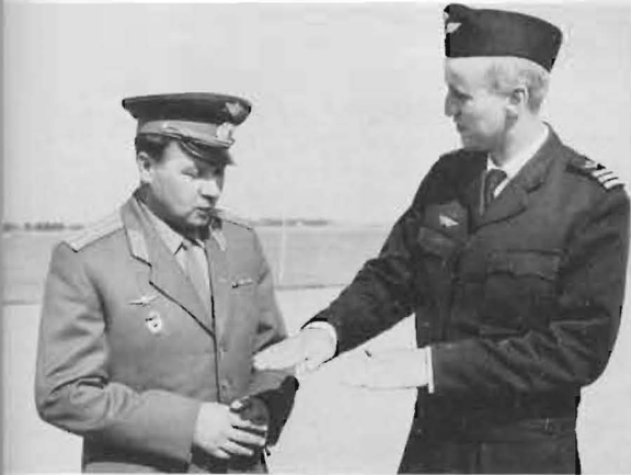
Ovan: Första sovjetiska flygbesöket i Sverige; F20, aug -67. Artikelförfattaren 'talandes' med sovjetisk flygkollega.