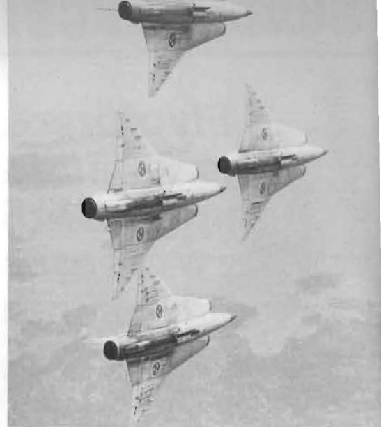
'Acro Deltas' ▲

Träning samt uppvisning. — För nya förare, som godkänts av CFV att ingå i gruppen, påbörjas grundträningen i rote med gruppchefen som rotechef. Under grundträningen som omfattar 15 rotepass, minskas flyghöjden successivt ned till uppvisningshöjd. Därefter påbörjas gruppflygning på höjd med den nya föraren