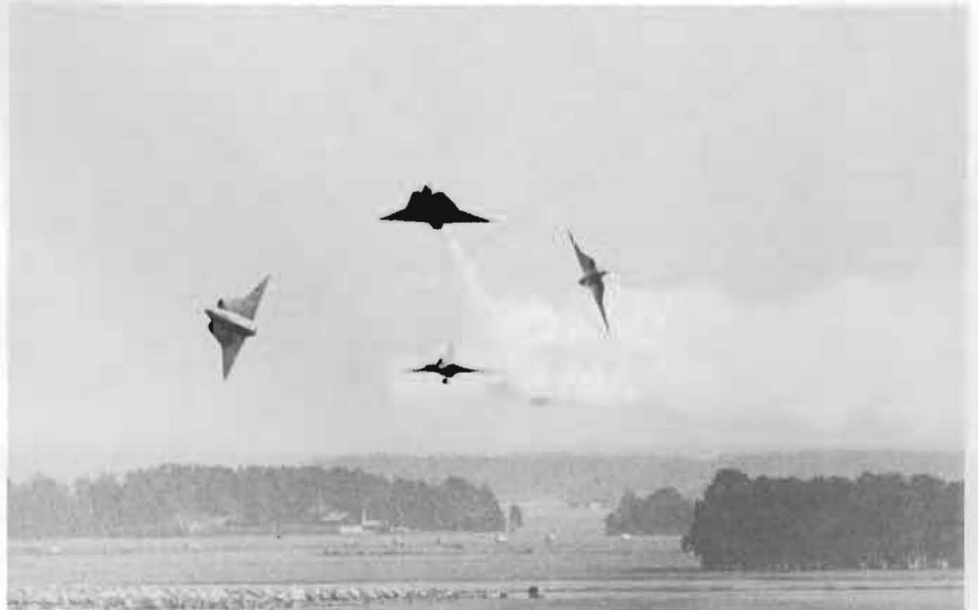
Ovan: 'Split up' på 'lågan' framför publiken.