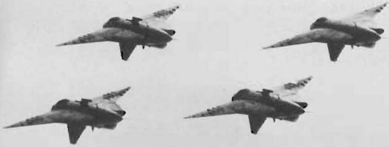
Ovan: 1967 års Paris-grupp på toppen av en looping i ruta.