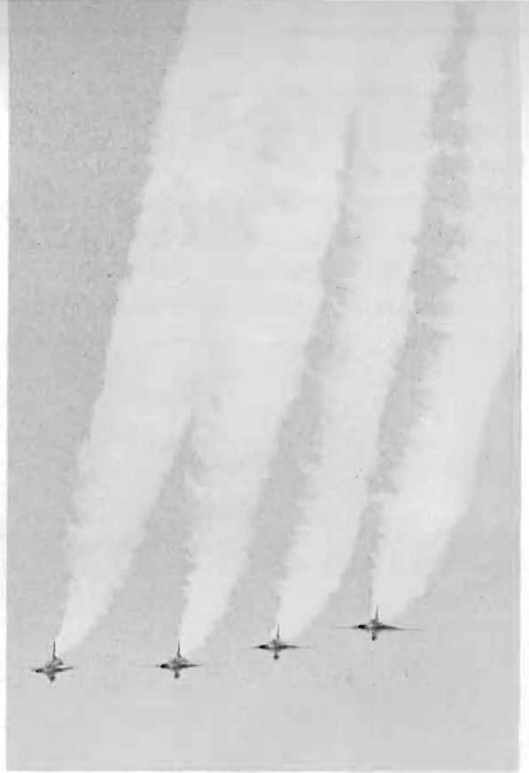
Ovan: Flanktormering etter looping.