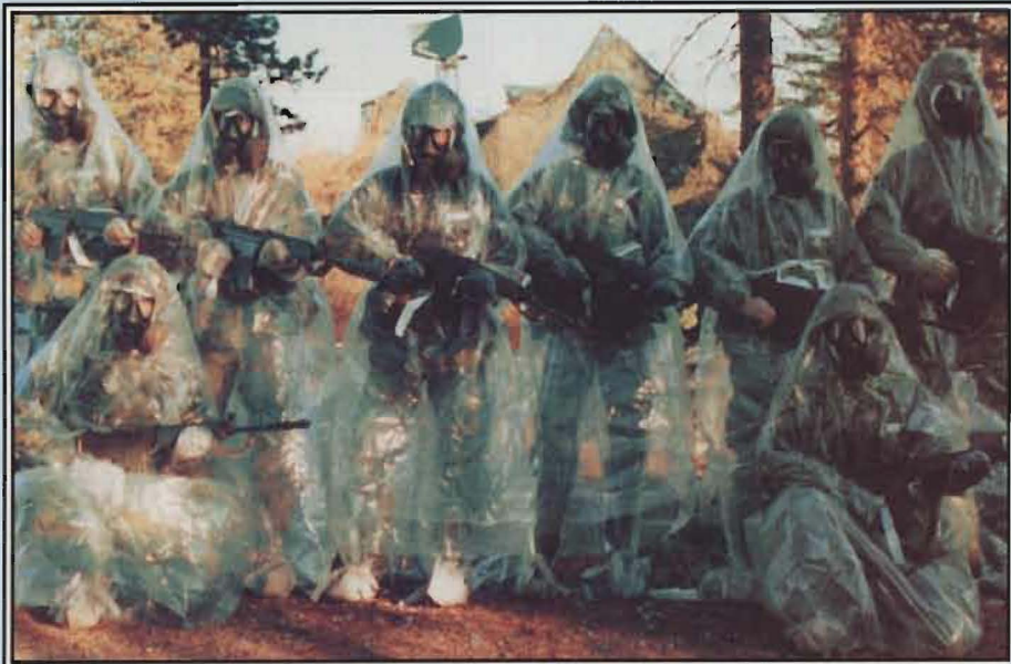
Vaktsoldater i ABC-utrustning under bevakning av låghöjdsradarsystemet PS-870.