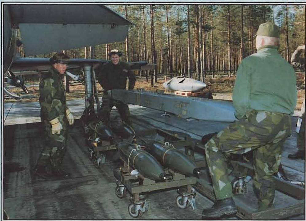
Klargöring av AJS 37 Viggen vid krigsbas. Våra värnpliktigas raska handgrepp imponerar på utlännigar.

OSSE-besök. – Jämtlands flygflottilj/F 4 och Skånska flygflottiljen/F 10 har varit värdar för utvärderingsbesök från Tyskland (se FV-Nytt 2/95, sid 11) respektive Storbritannien inom ramen för OSSE (f d ESK).