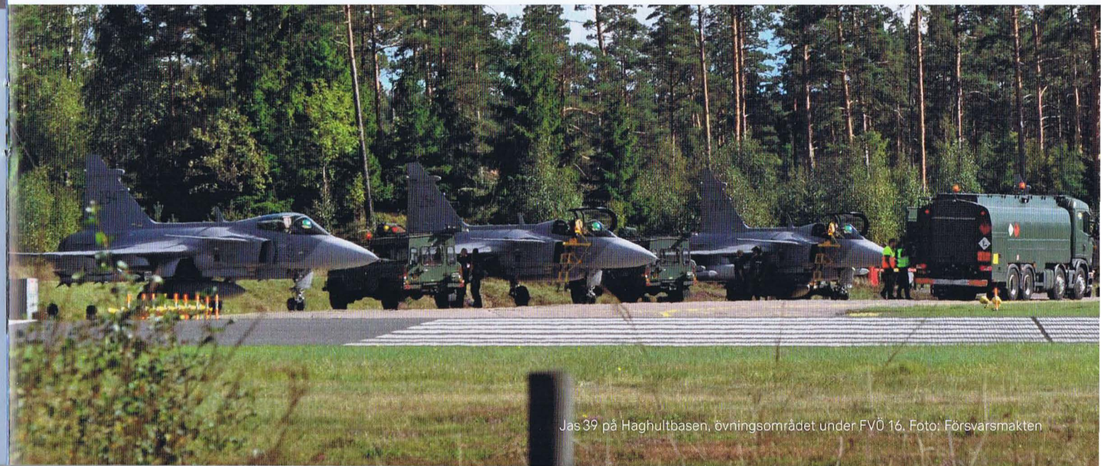
Jas 39 på Hagshultbasen, övningsområdet under FVÖ 16.