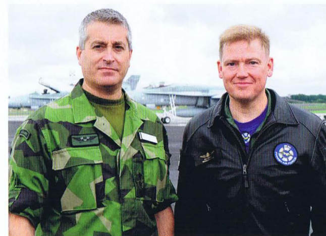
Svenska och finska flygvapencheferna på besök på Gotland under FVÖ 16.