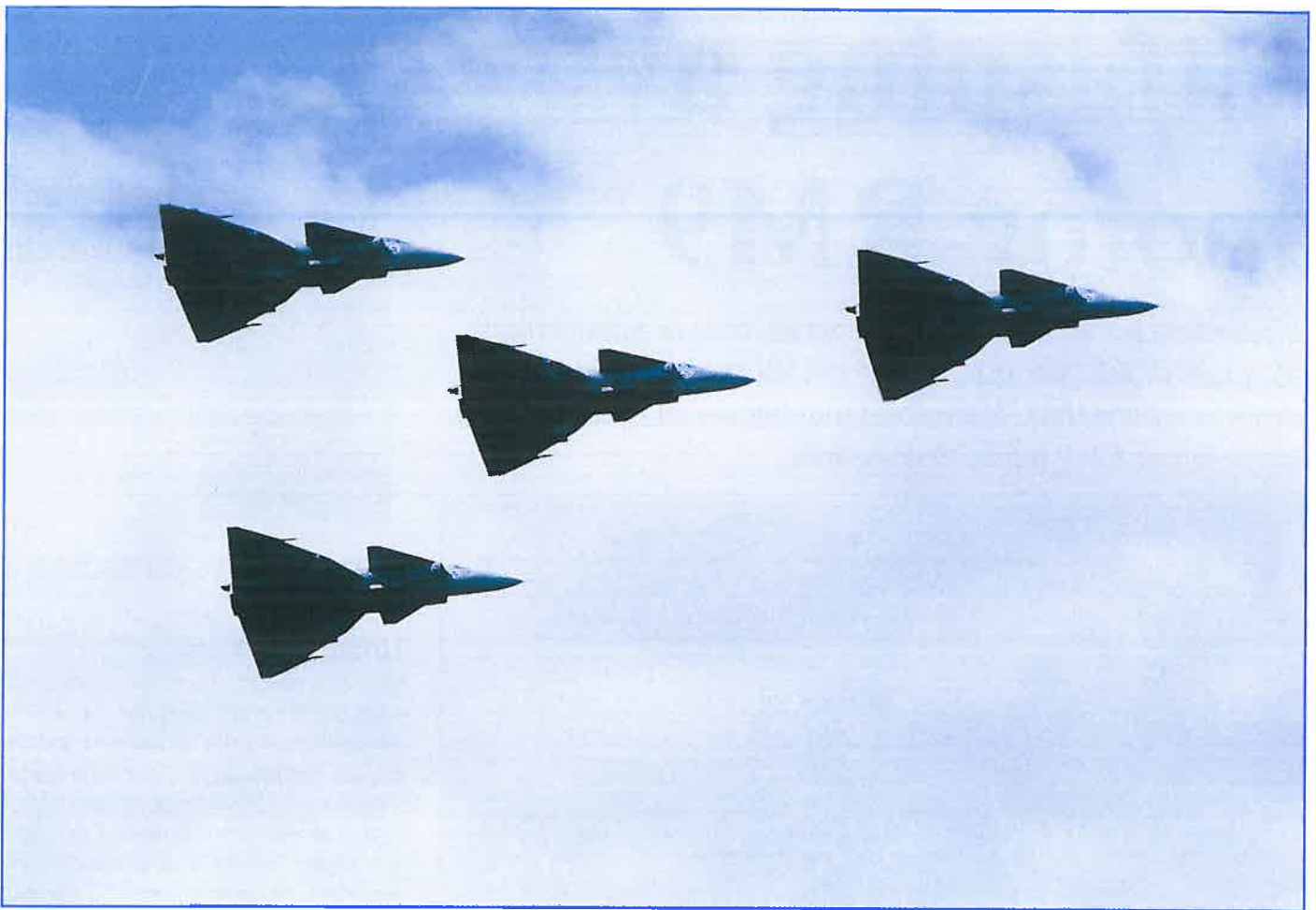
En grupp JA37 från F17 i sitt rätta element