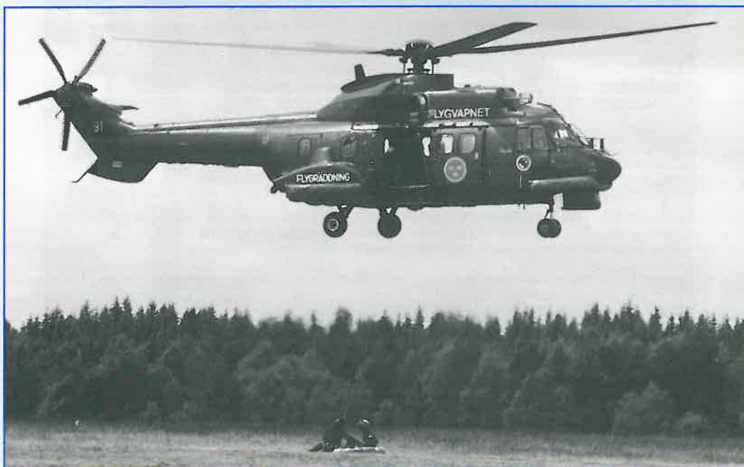
Hkp 10 demonstrerade bl a räddning av nödställd från flotte