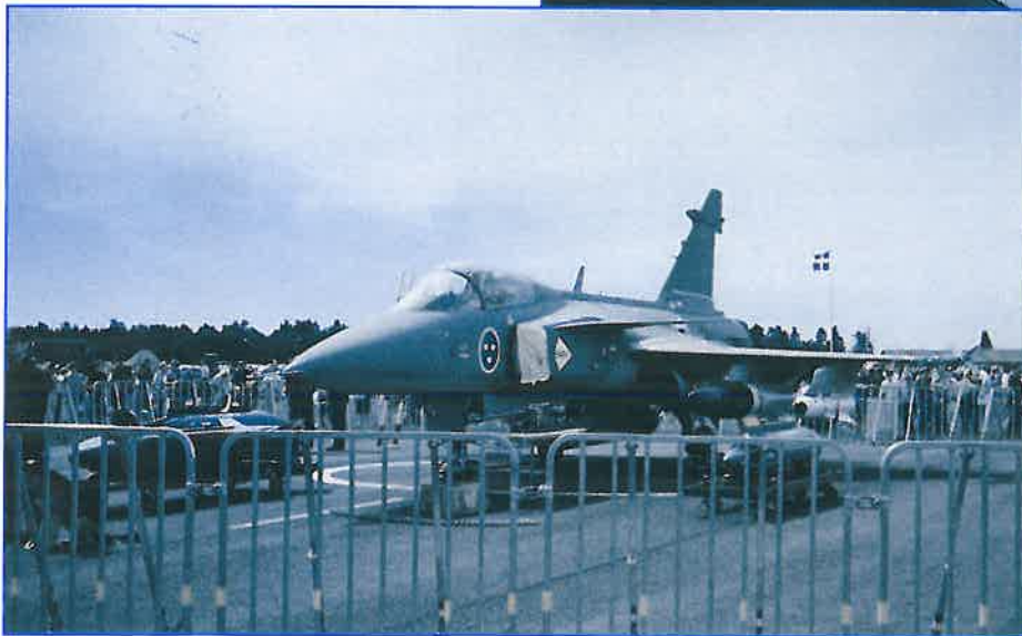
F17:s historia i bilder, arrangerat av fotograf Gösta Bolander, kunde beskådas