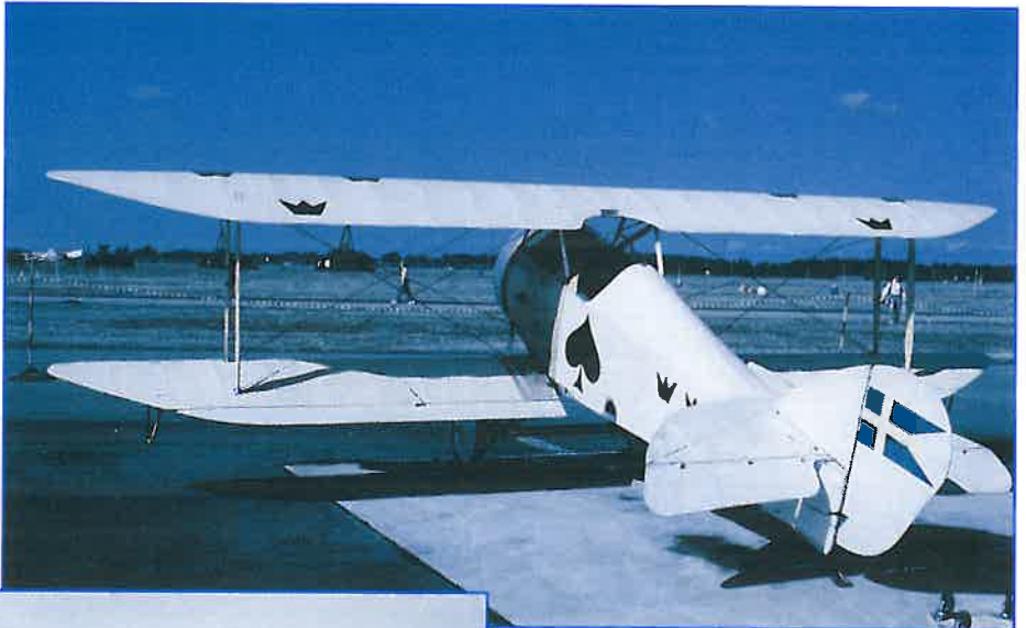
Utställningens äldsta och yngsta flygplan

TIFF GRATULERAR och önskar F17 lycka till i framtiden.